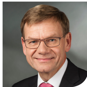
→ Dr. Johann Wadephul MdB